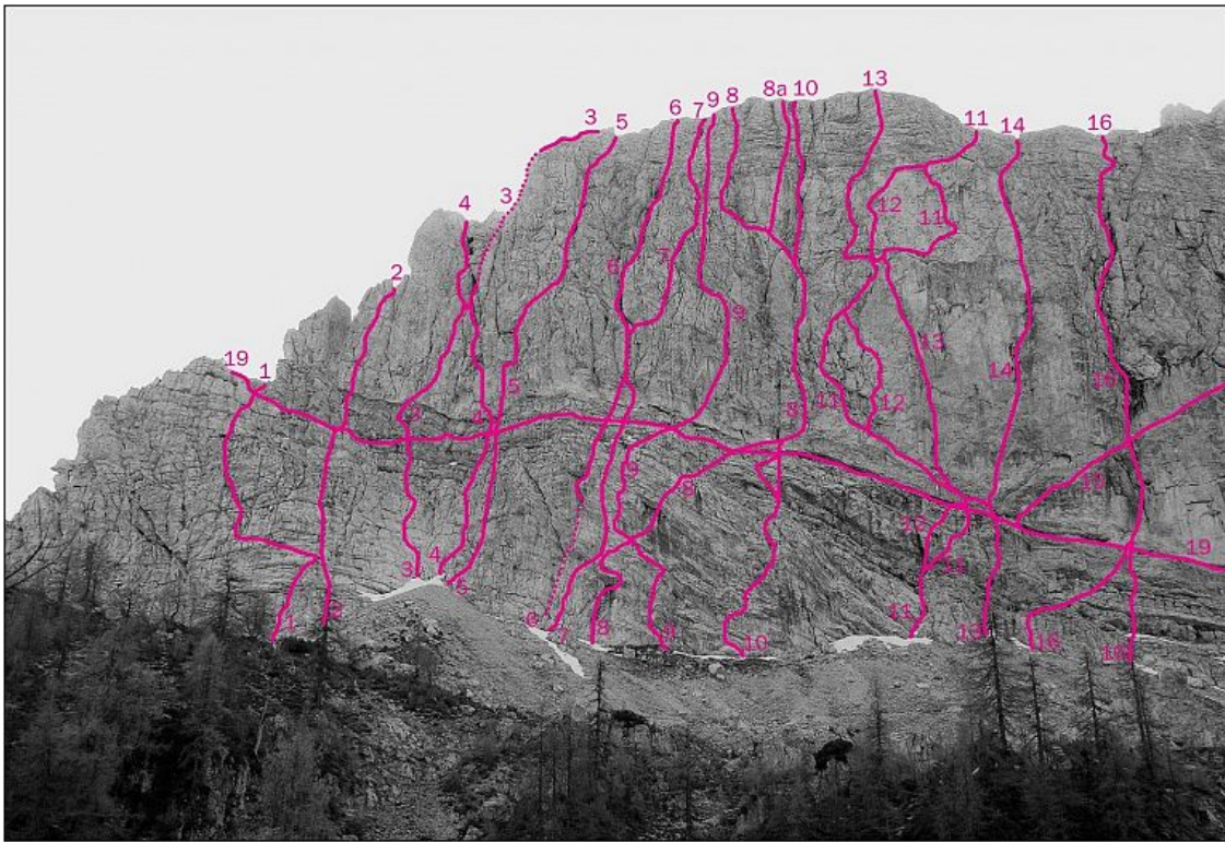
Nad Šitom glava, severna stena: 1 Solze strahu, 2 Svinjska gostija, 3 Kranjska poč, 4 Tandara-Mandara, 5 Riba, 6 Trmasti kamini, 7 Vodnjak želja, 8 Vsiljivka, 8a Varianta, 9 Sokol, 10 Smer po zajedi, 11 Spiroheta, 12 Ognjeni krst, 13 Spominska smer Srečka Rihtarja, 14 Yassa, 14a Zimska varianta, 15 Madonna, 16 Visoki pritisk, 19 Prečenje.