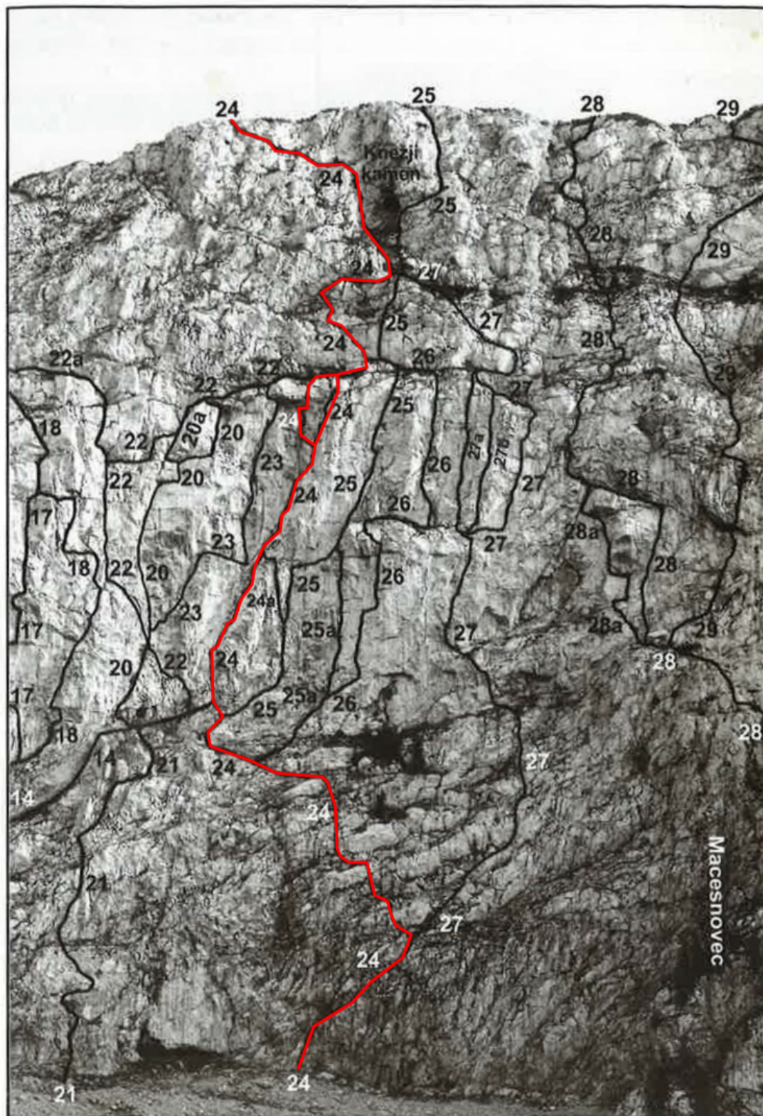
Mala Raduha, severna stena: 14 Prečenje Male in Srednje Raduhe, 17 Poslednji Mohikanec, 18 Živa, 20 Rododendron, 20a Varianta smeri Rododendron, 21 Taborniška varianta, 22 Levo od Plat, Varianta smeri Levo od Plat, 23 Zajeda, 24 Plate, 25 Dorkina smer, 25a Poč - varianta Dorkine smeri, 26 Maček, 27 DD, 27a Mamina - varianta smeri DD, 27b Varianta smeri DD, 28 Kovačeva smer, 28a Knapovska - varianta Kovačeve smeri, 29 Koroška smer.