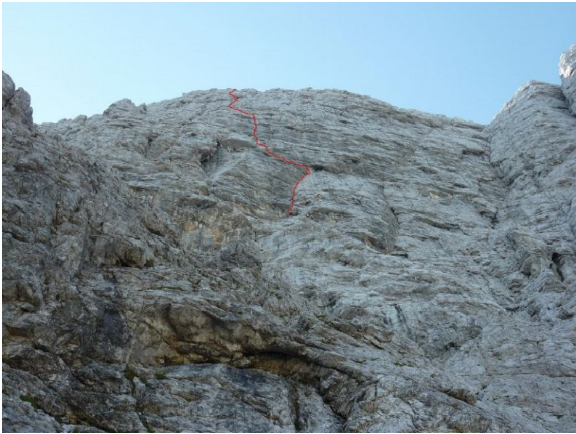
Velika Mojstrovka, severna stena: Thunder (vris).