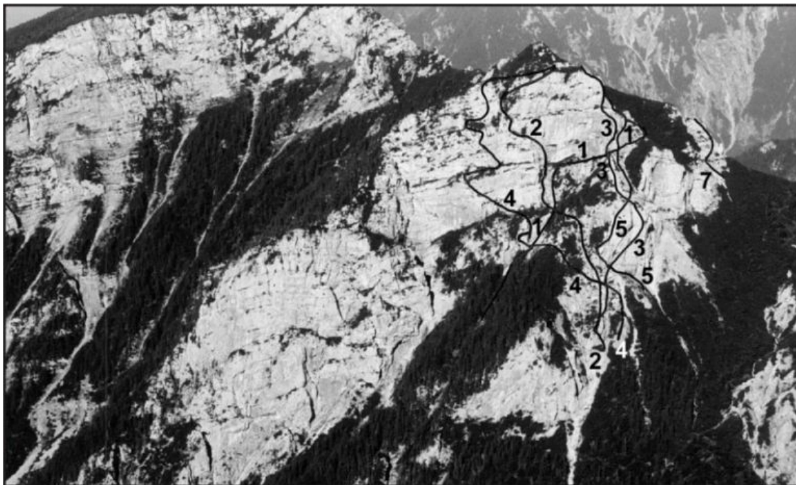
Lučka Kopa: 1 Grapa izgubljenega škrata, 2 Beli cvet, 3 Sneguljčica, 4 Črnomaljska smer, 5 Renatina smer, 7 Miniatura.