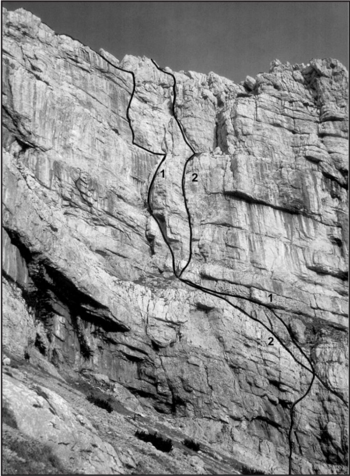
Lastovec: 1 Turbo petka, 2 Tiha voda.