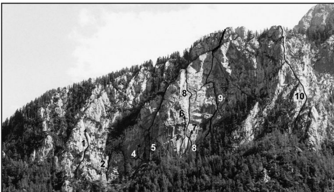
Predostenje Križevnika - levi del: 1 Kamin, 2 Rilčkova smer, 4 Sulc, 5 Lazar, 6 Roža, 7 Jupiter, 8 Puščica, 9 Pastirska smer, 10 Hostarska smer.