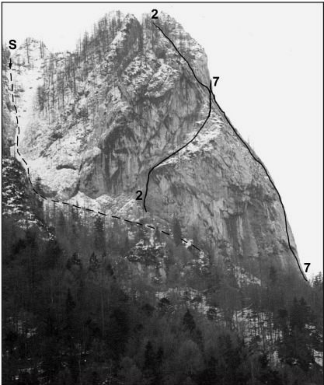
Predostenje Križevnika - Turnič: S sestop za Turničem, 2 Matilda, 7 Nirvana.