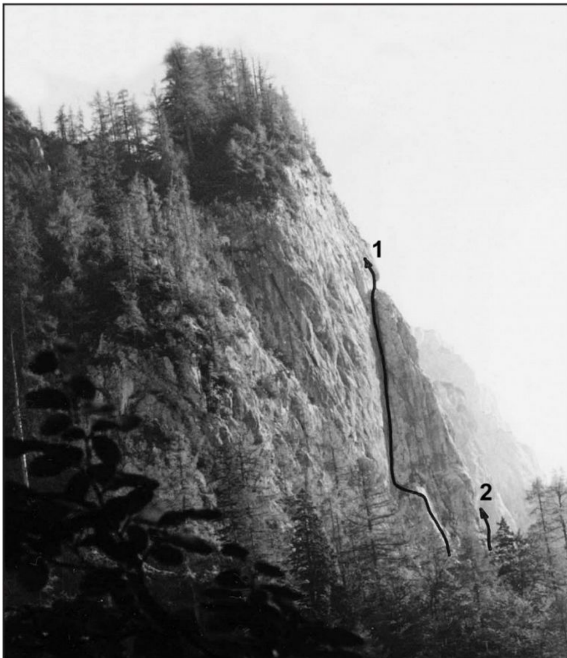
Predostenje Križevnika - desno pod Turničem: 1 Igla, 2 Orlova smer.