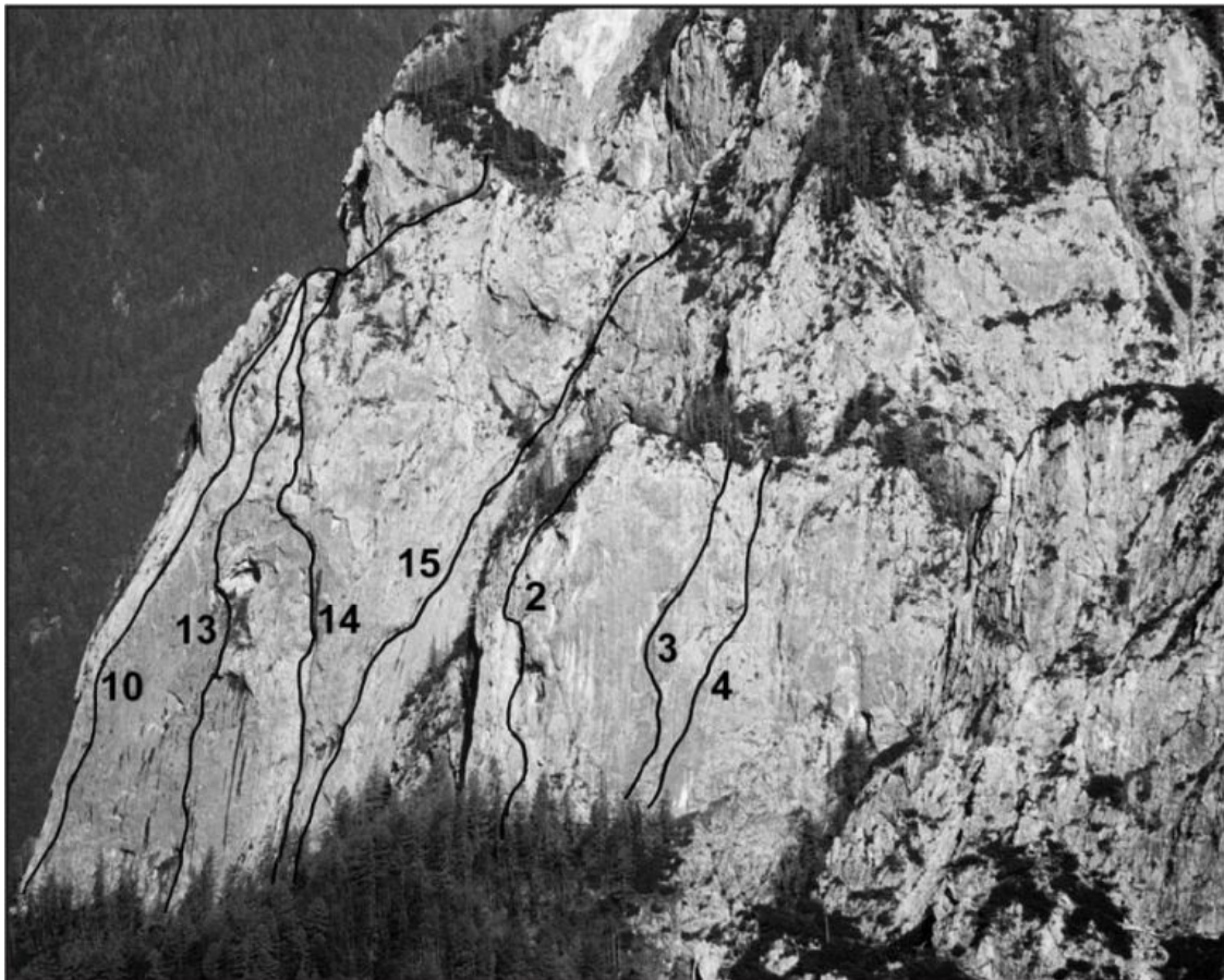
Predostenje Križevnika - Turnič: 10 Abadonov nasmeh, 13 Mimo votline, 14 Pavrska smer, 15 Sansara. DESNO POD GLAVNO STENO: 2 Orlova smer, 3 Dobrota, 4 Bodlika.