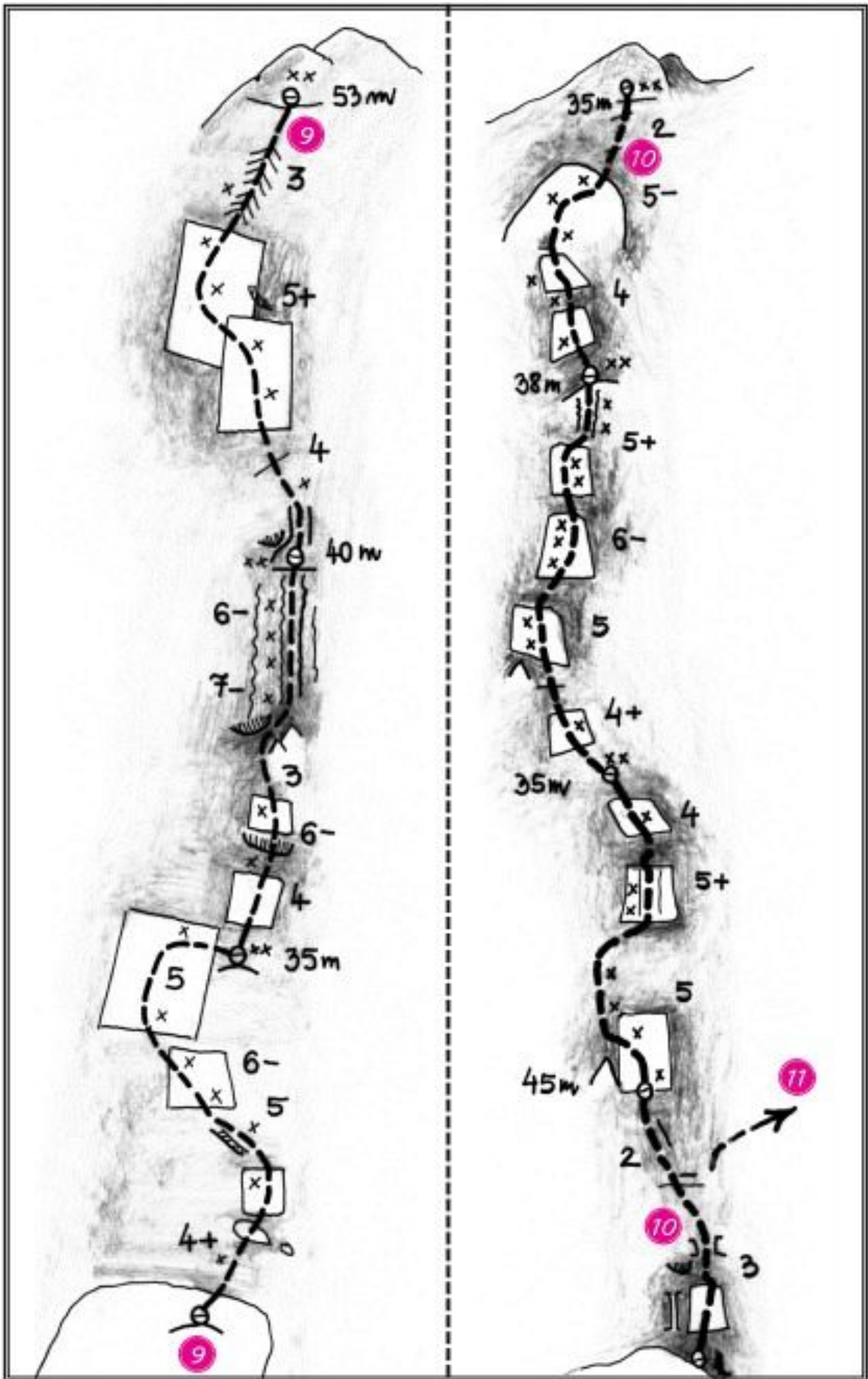
Staničev vrh, jugovzhodna stena: 9 Zatišje, 10 Košček neba, 11 Svetla stran meseca.