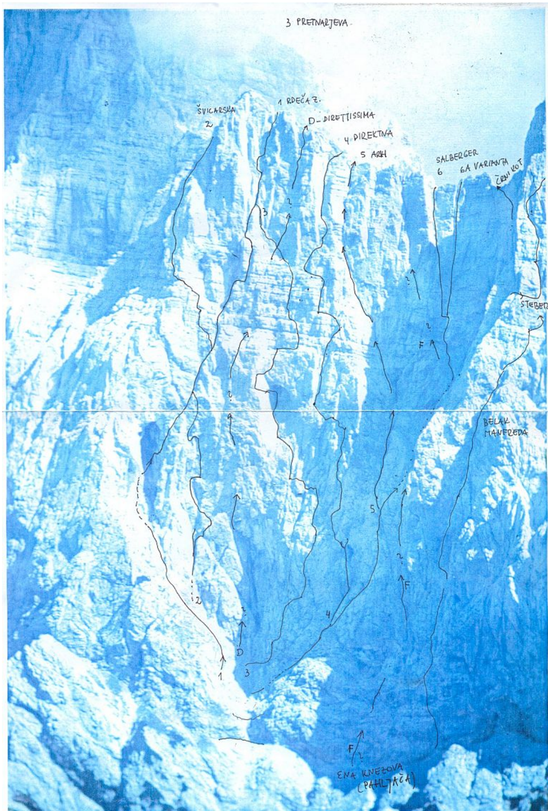
Rakova špica, severozahodna stena: 1 Rdeča z., 2 Švicarska, 3 Pretnarjeva, 4 Direktna, 5 Arihova, 6 Salberger, 6a Varianta.