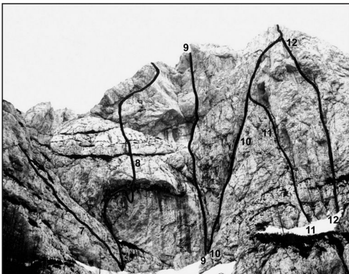
Križevnik: 7 Na steber, 8 Giljotina, 9 Kamniti krst, 10 Diagonala, 11 Šoštanjska smer, 12 Nos.