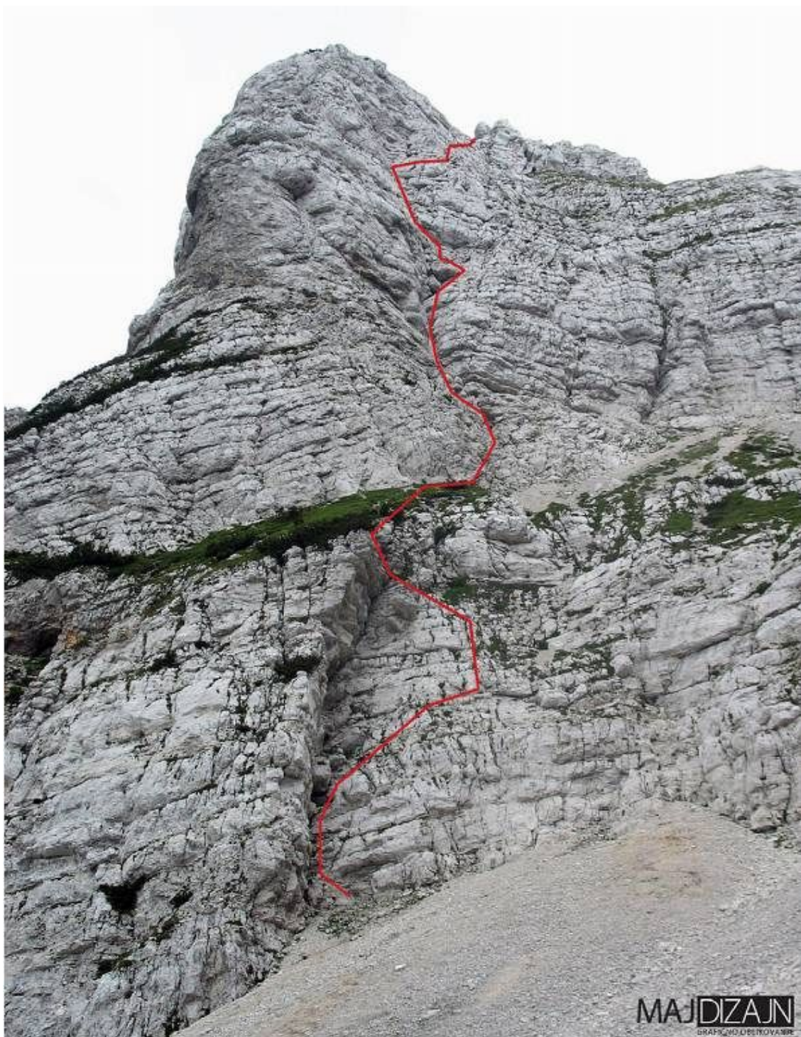
Mala Mojstrovka (Grebenec): Pocarska.