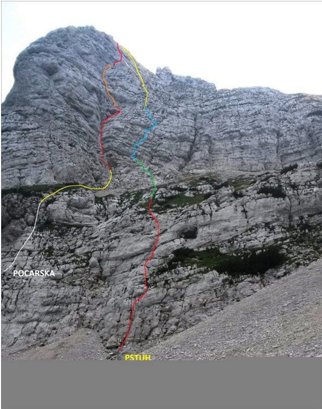
Mala Mojstrovka (Grebeneč): Pstuh.