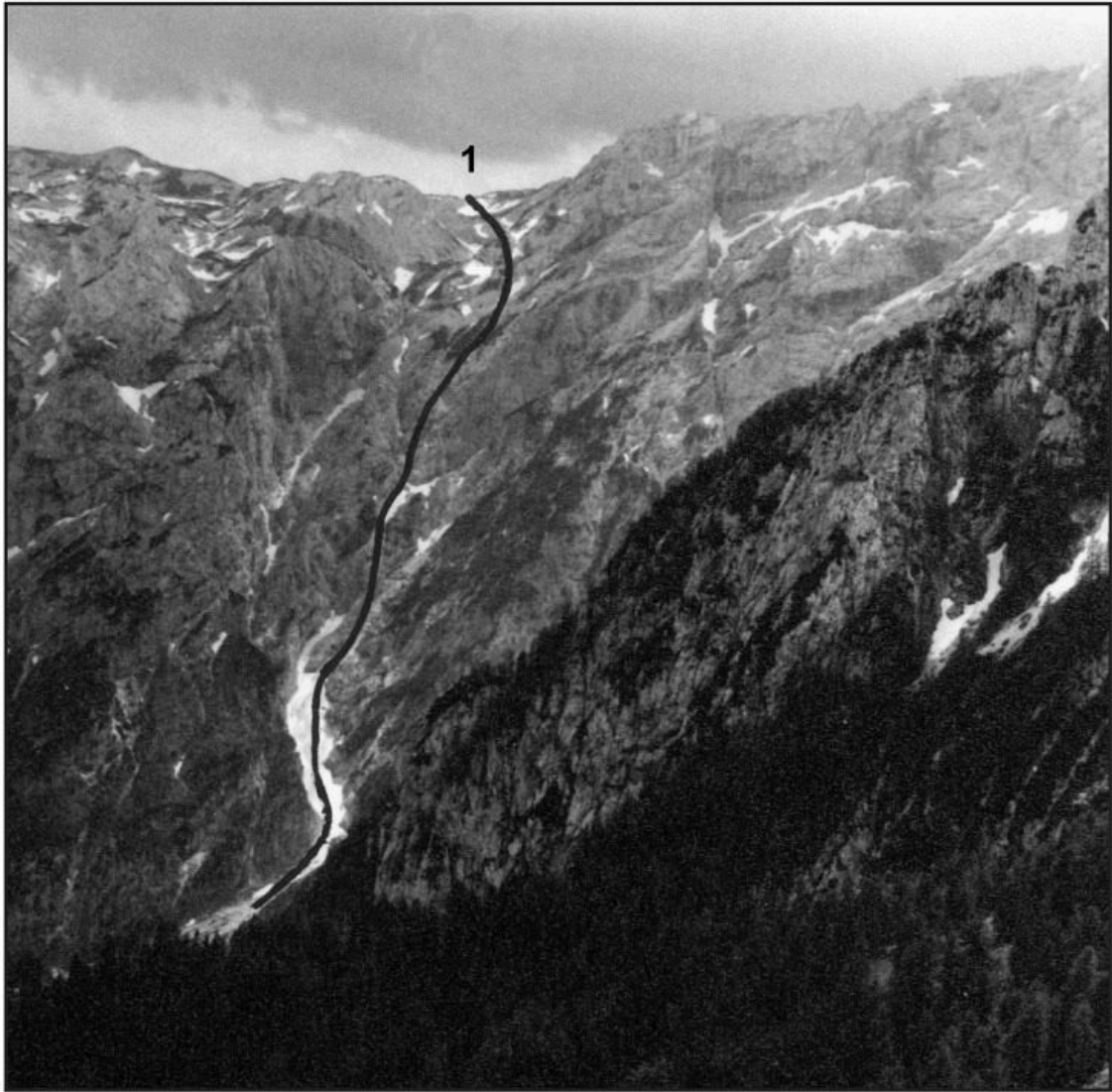
Slika 65 OJSTRICA, vzhodna stena: 1 Kocbekova grapa.

Ojstrica, vzhodna stena: 1 Kocbekova grapa.