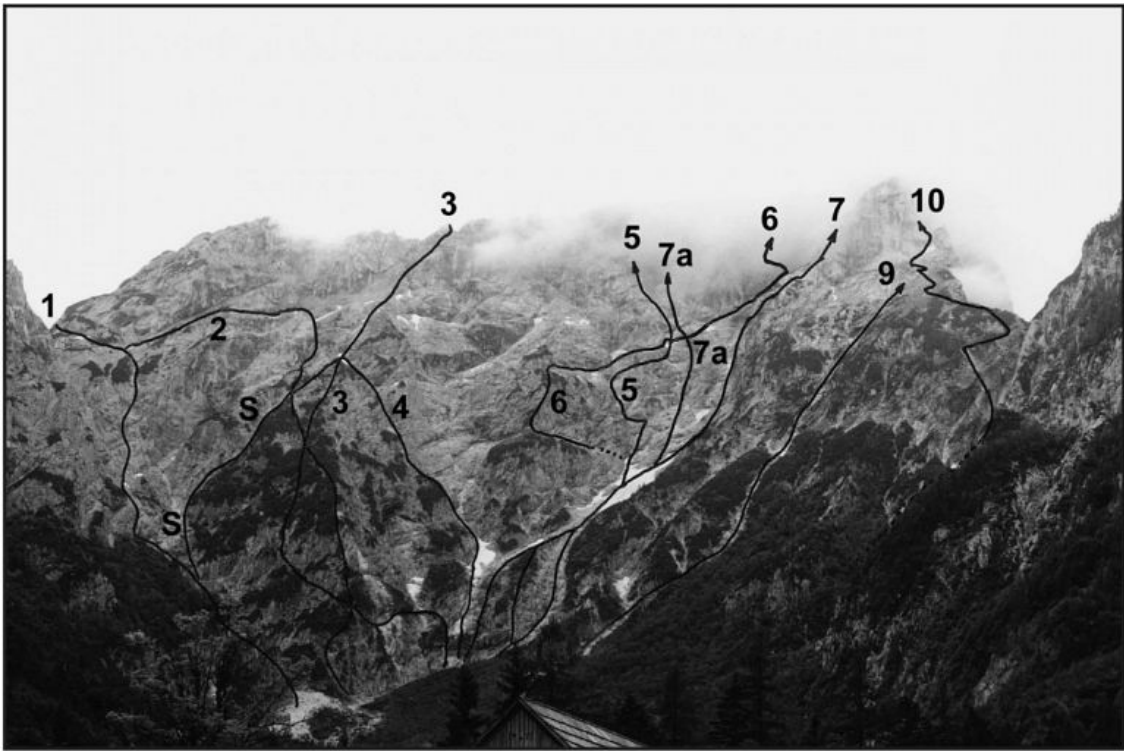
Ojstrica, vzhodna stena: 1 Kocbekova grapa, 2 Pozabljena vponka, S Sestop za Sneguljčico, 3 Mehova smer, 4 Sneguljčica, 5 Smer Y, 6 Smer Gračner-Krajnc, 7a Varianta Tschadove smeri, 7 Smer Palouz-Tschada, 9 Kopinškova (smer) pot, 10 Severovzhodni greben.