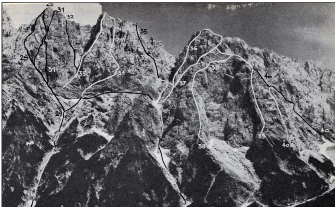
Sl. 30: RAKOVA ŠPICA, ROGLJICA in DOVŠKI GAMSOVEC — severozahodno ostenje RAKOVA ŠPICA : 429 Smer po stebri, 430 Rdeča zajeda, 431 Švicarska smer, 432 Arihova smer, ROGLJICA : 433 Osrednji steber, 434 Smer Jesih-Lipovec, 435 Zahodni steber, DOVŠKI GAMSOVEC : 336 Jeseniška smer, 437 Kalteneggerjeva smer, 438 Severozahodni steber, 439 Zahodni steber, 440 Jugozahodna smer, 440a Varianta

Rakova špica: 29 Smer po stebri, 30 Rdeča zajeda, 31 Švicarska smer, 32 Arihova smer.