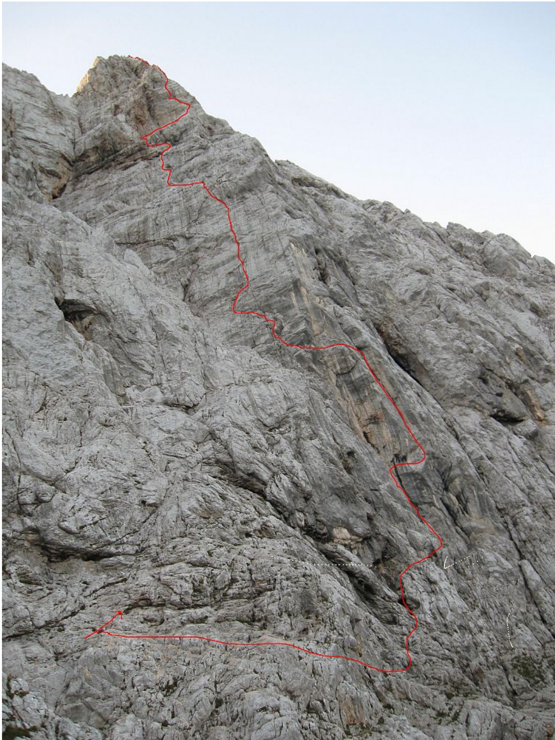
Rogljica, severozahodna stena: Iskalec lepote (vris).