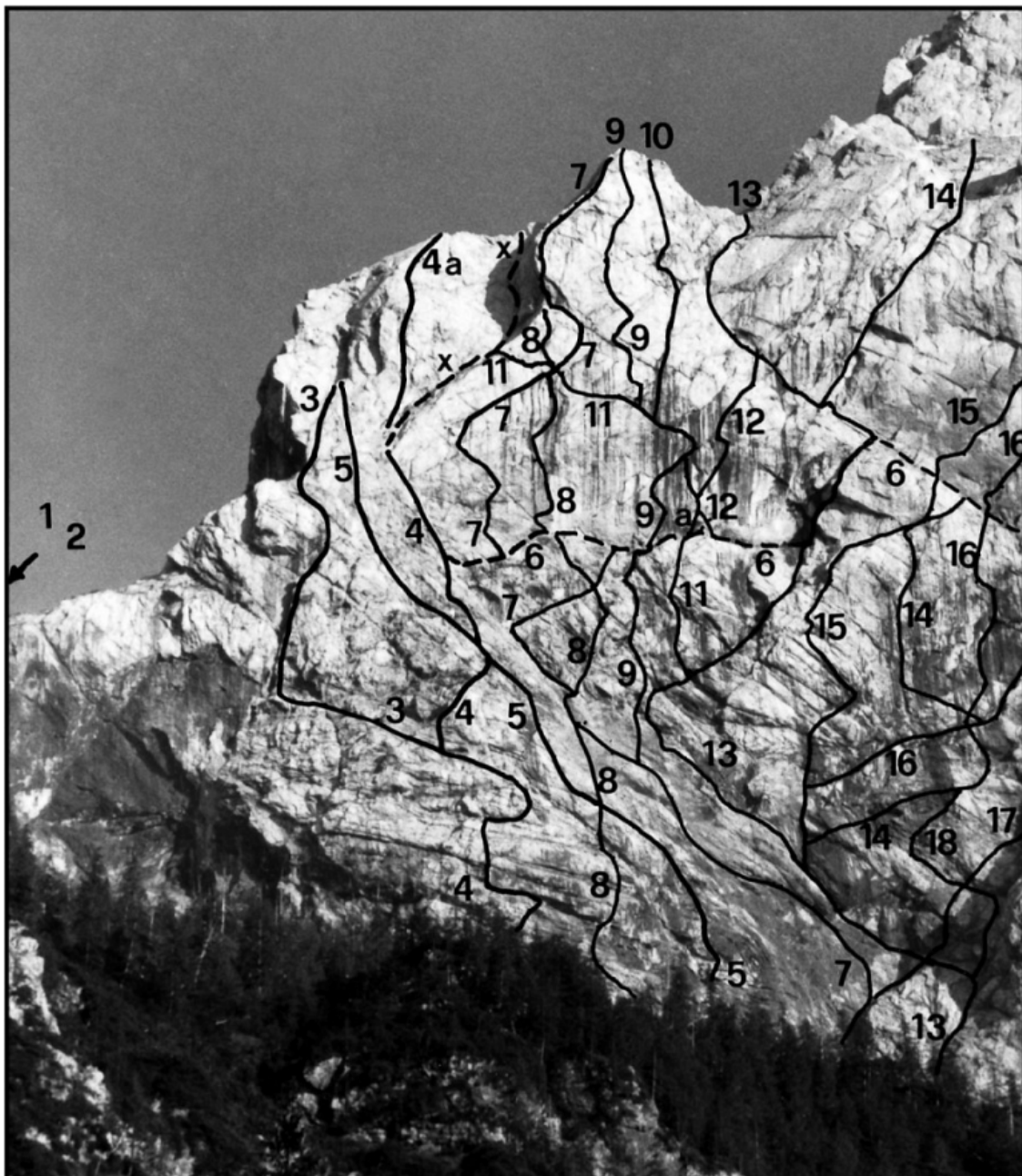
Ojstrica, SV stena: 1 Megleni žarek, 2 Črna vdova. OJSTRICA, SEVER: 3 Smer Krumpak-Pristovnik, 4 Leva smer, 4a Black crack x. Smer Arbeiter Geenits-Weitzenbock (zgornji del leve smeri), 5 Beli trapez, 6 Prečenje stene, 7 Jančeva piramida, 8 Freska jokajoče smrti, 9 Puščava sna, 10 Smer Džoli Jocker, 11 Bumerang, 12 Smer zahajajočega sonca, 13 Herle-Vršnik, 14 Spominska Cerjakova smer, 15 Izziv, 16 Nejčeva smer, 17 Minljivost, 18 Spominska smer Iva Reye (Zmaj).