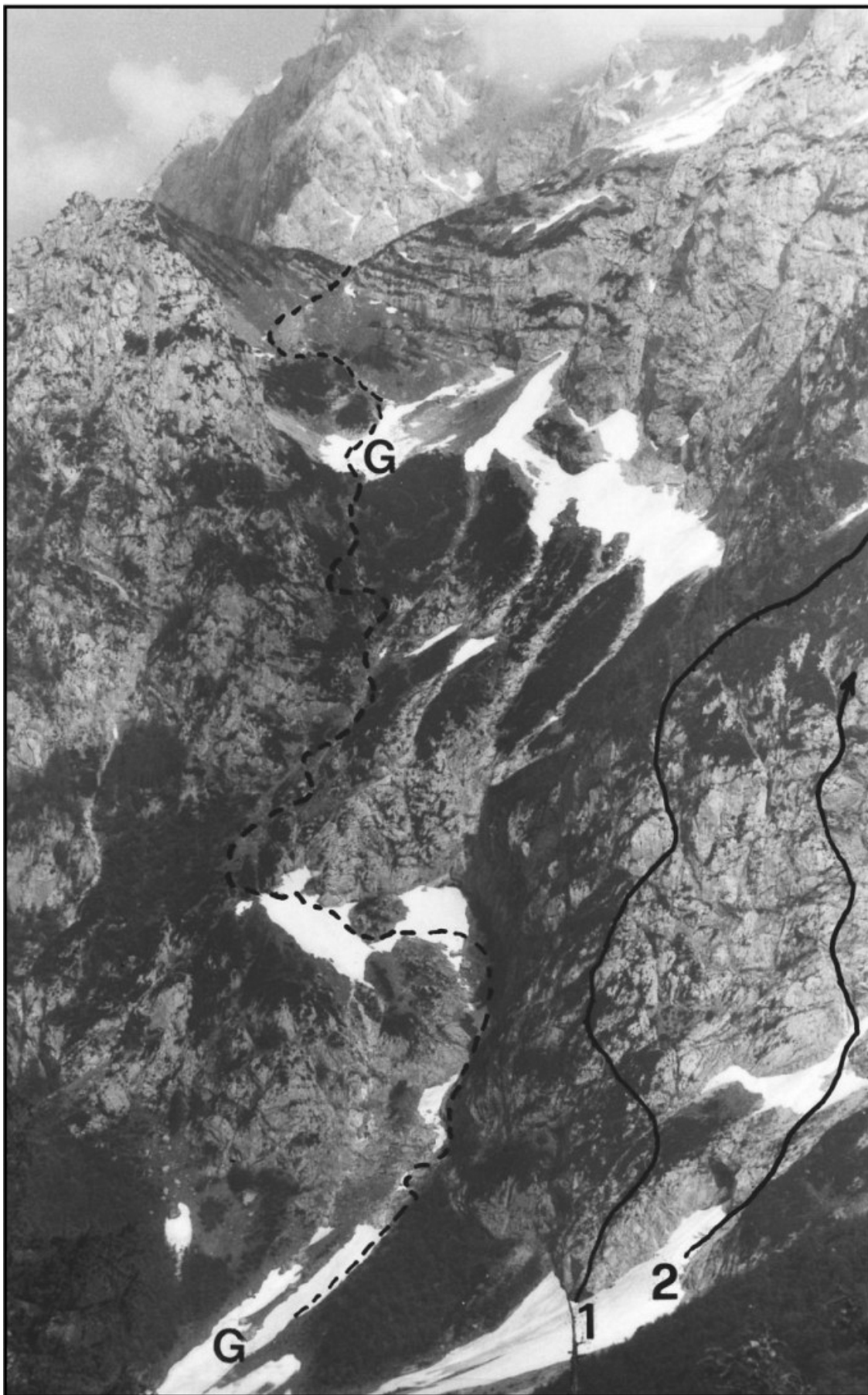
Planjava pot čez Grlo ,severna stena: 1 Levi greben, 2 Desni bok Levega grebena.