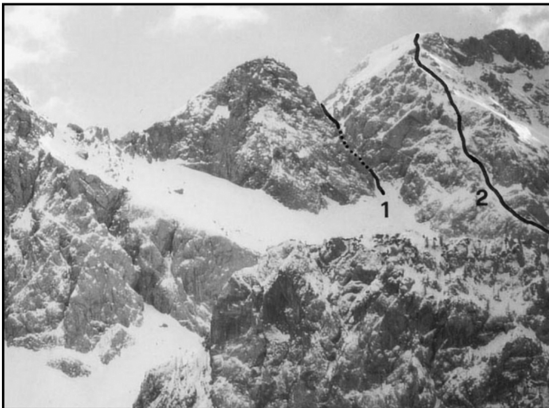
Lučka Brana - Baba, severovzhodna stena: 1 Grapa, 2 Severni greben.