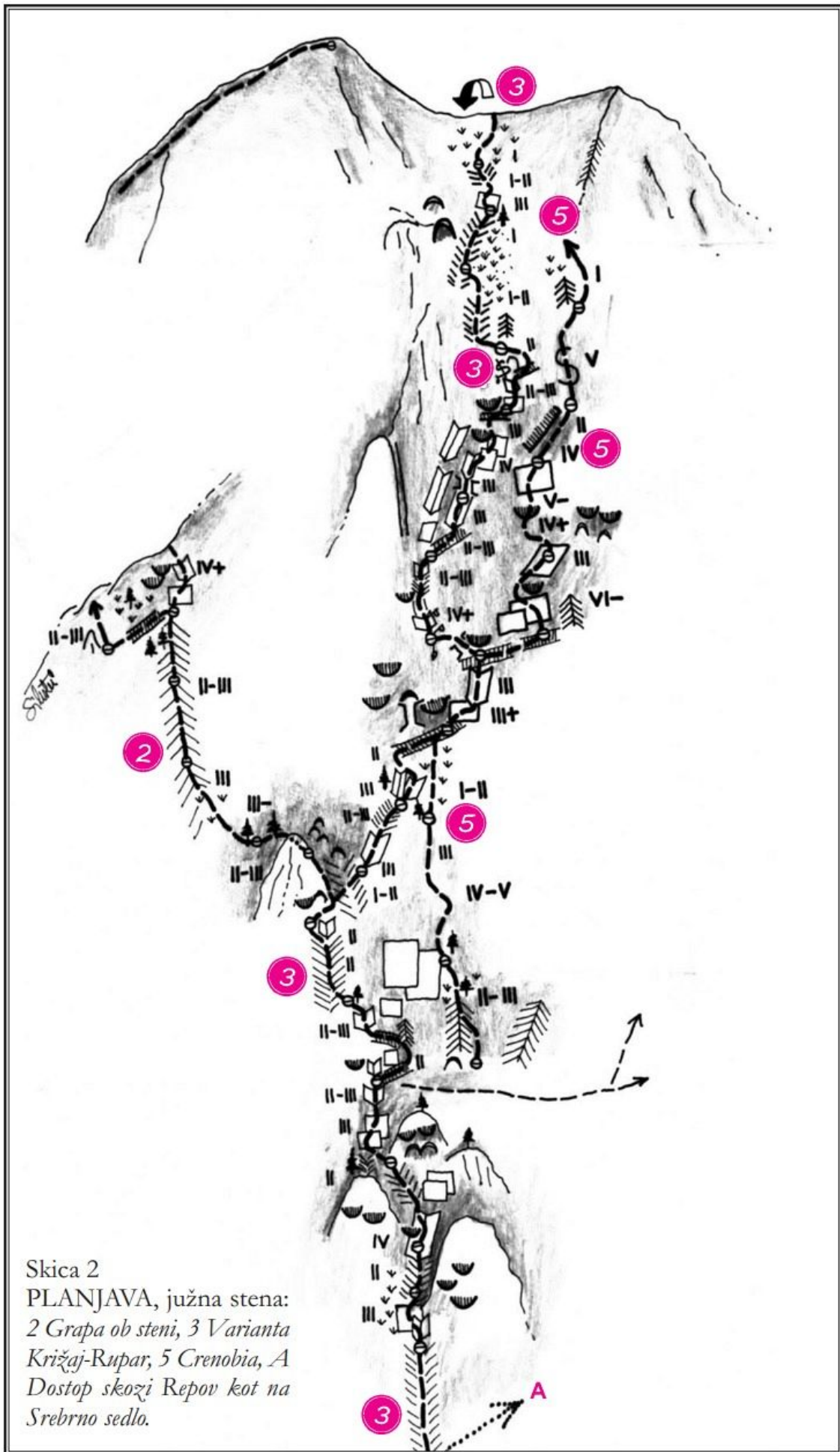
Skica 2 PLANJAVA, južna stena: 2 Građa ob steni, 3 Varianta Križaj-Rupar, 5 Crenobia, A Dostop skozi Repov kot na Srebrno sedlo.