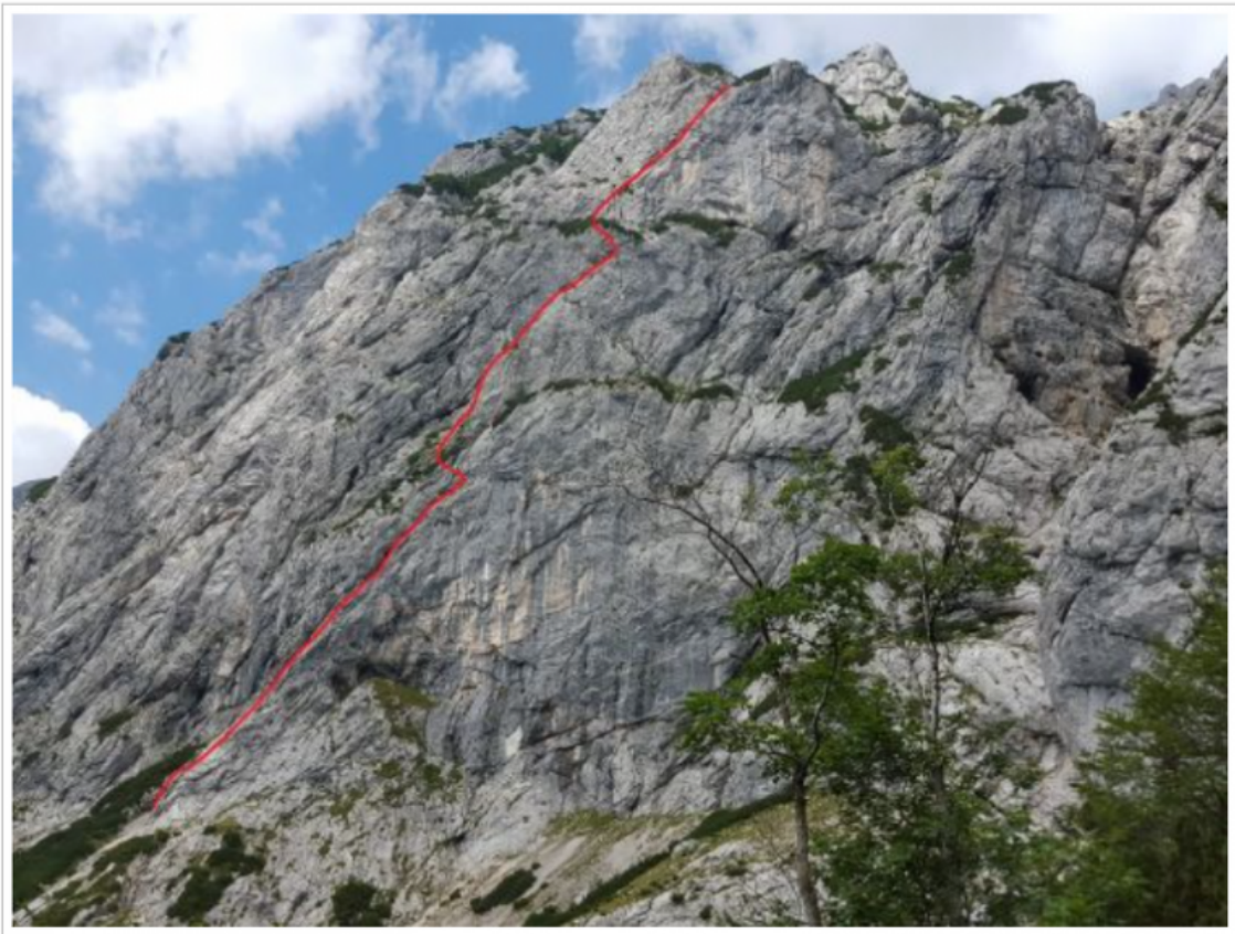
Sešetra (vris smeri).