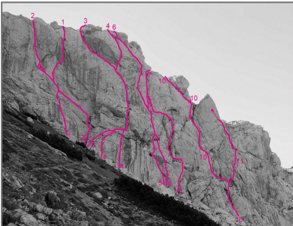
Vršiči, severozahodna stena: 1 Gamsi, 2 Kazalčeva smer, 3 Hair, 4 Kekčeve ukane, 5 Smer zaspancev, 6 Rdeča vrtnica, 7 Večerna smer, 7a Vstopna varianta Večerne smeri, 10 Smer mimo votline, 11 Bela piramida.