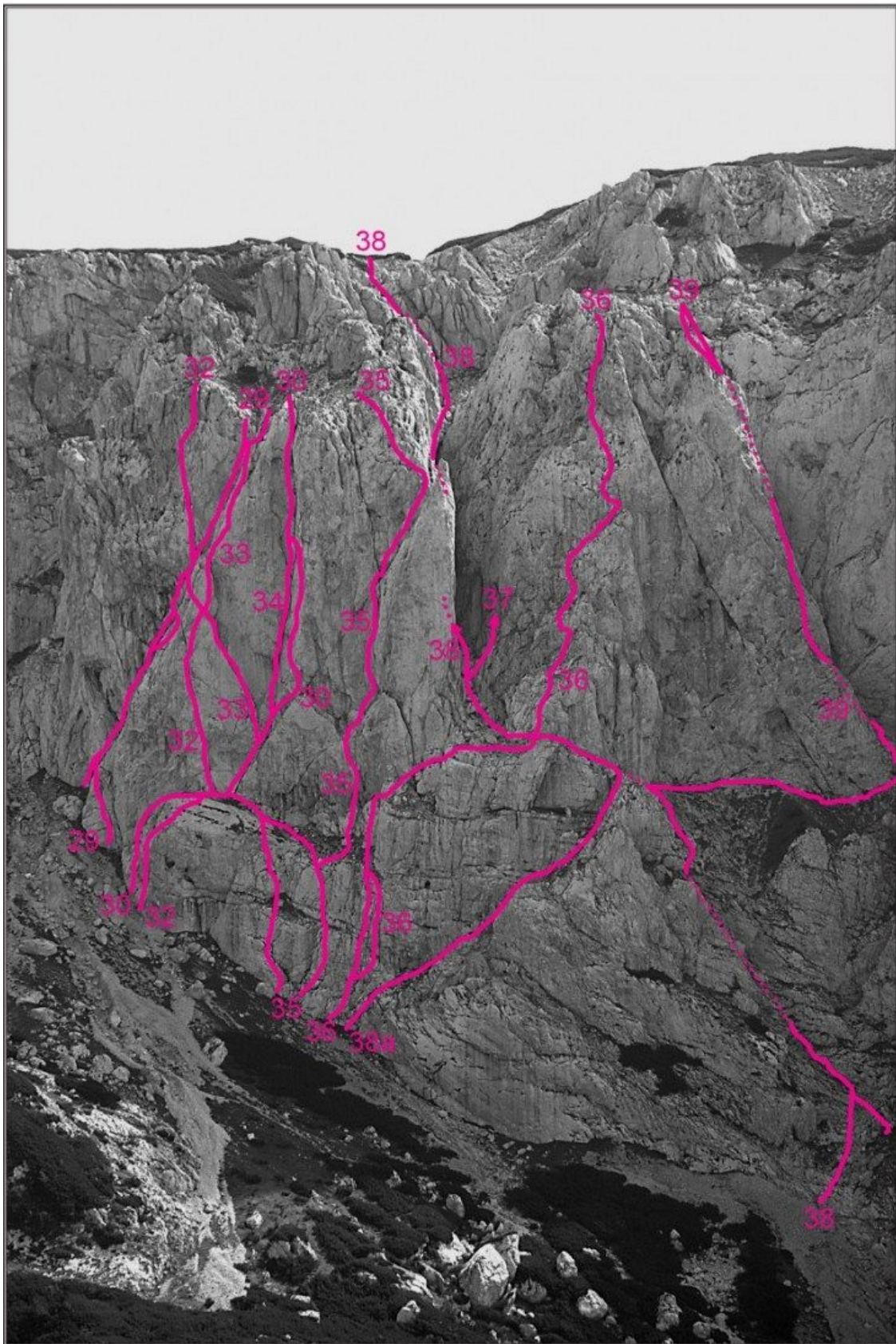
Vršiči, severozahodna stena: 29 Lukmanova smer, 30 Kamniška smer, 30a Vstopna varianta, 32 Mačja zibka, 33 Zasavska smer, 34 Vroča poč, 35 Mengeška smer, 36 Bolostaja, 38a Vstopna varianta, 38 Grapa, 39 Beli steber.