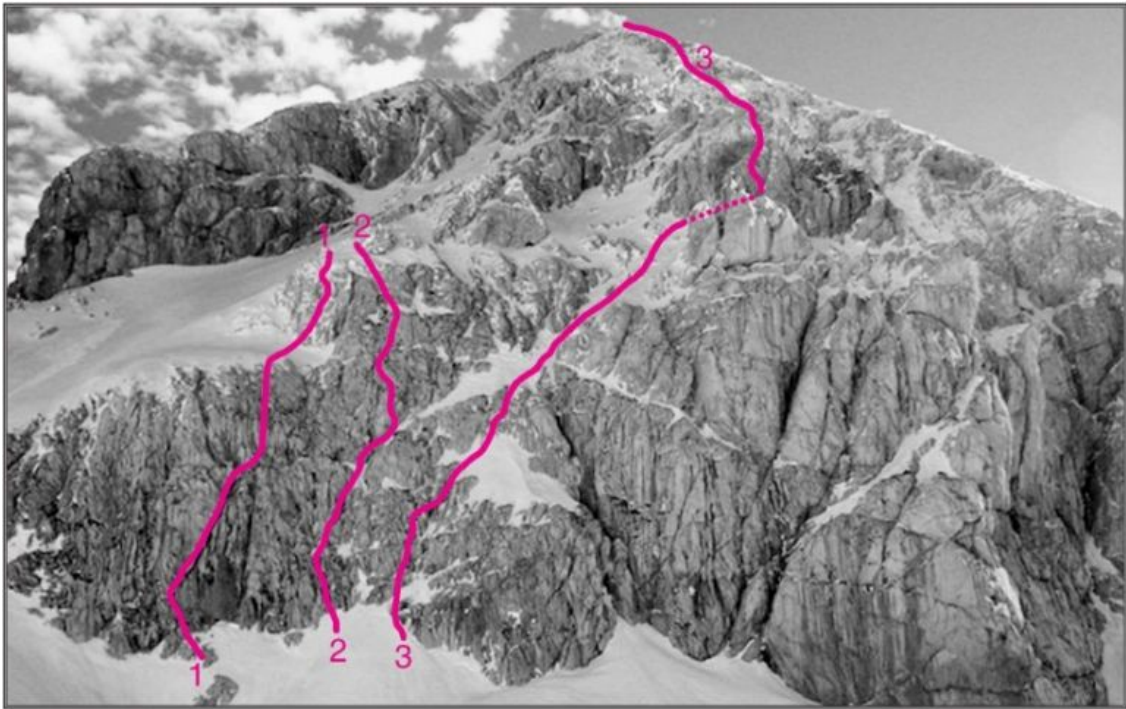
Grintovec, zahodna stena: 1 Peščene ure, 2 MMS, 3 Kje si sonce.