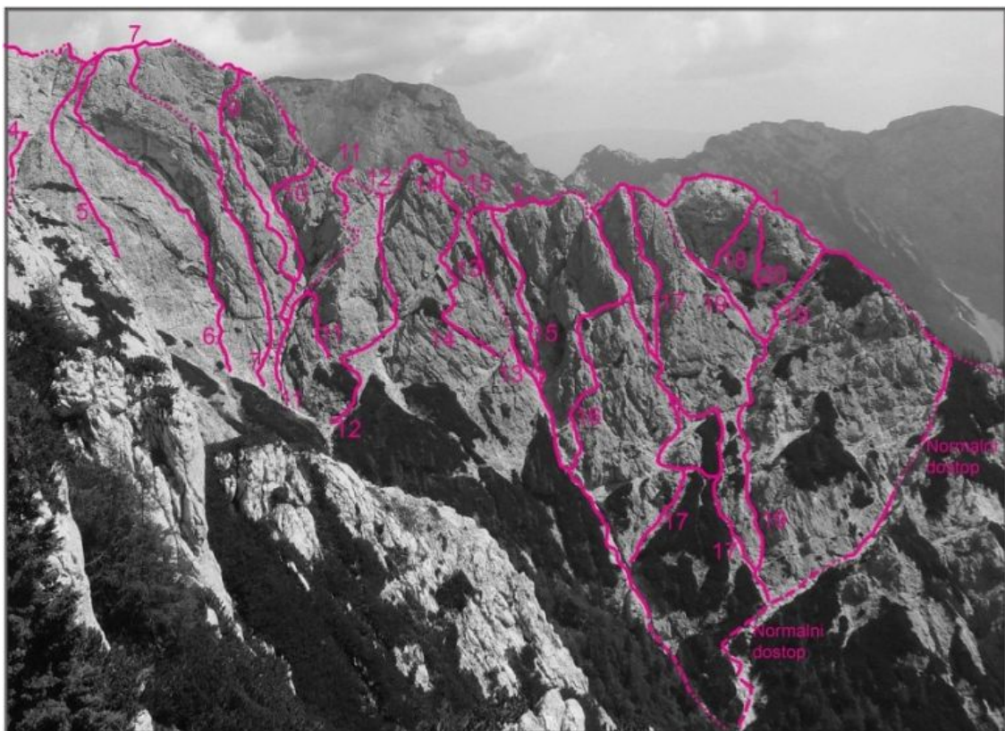
Zeleniške špice, Debeli špic, severozahodna stena: 4 Namizni prt, 5 Smer Hansel-Roter, 6 Smer Berčič-Golob, 7 Zajeda, 9 Poševna smer, 10 Smer drenovcev. ZELENišKE ŠPICE, od Debelega špica do Staničevega vrha, severozahodna stena: 11 Kamela, 12 Smer kar tako, 13 Padalska grapa, 14 Heksenšus, 15 Dolomitska smer, 16 Smer Režek-Tarter, 17 Najdena smer. ZELENišKE ŠPICE,