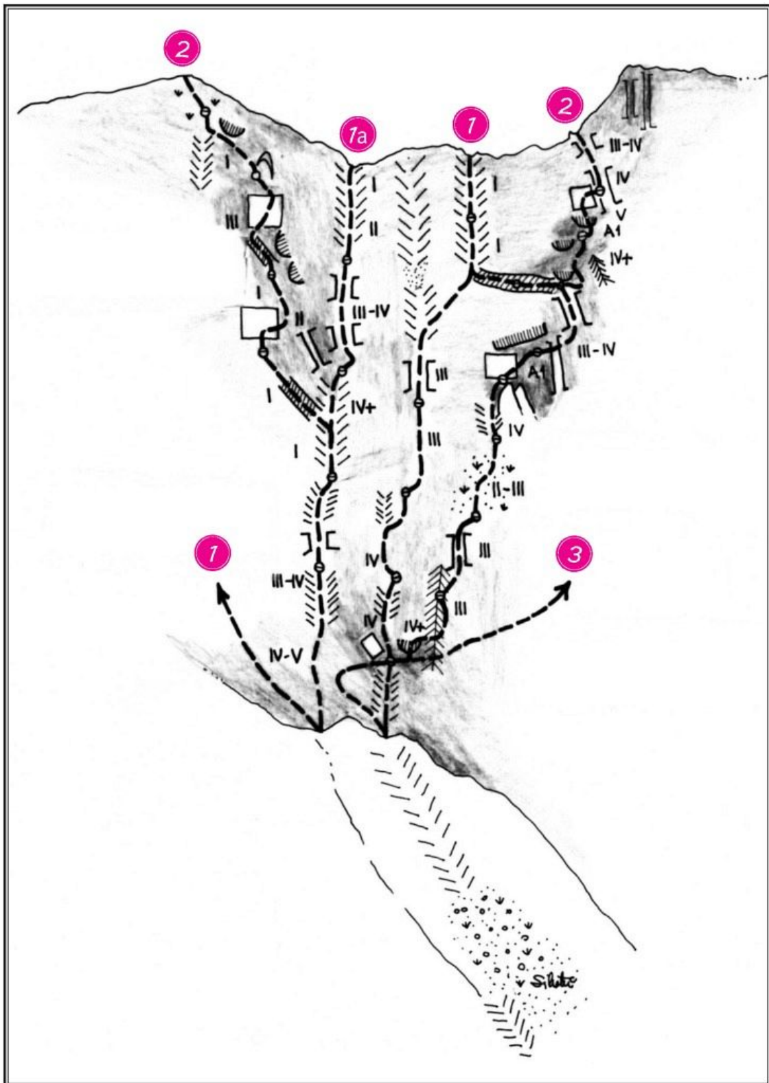
Konj, severozahodna stena: 1 Smer bratov Gregorin, 2 Smer Bele-Grum-Klemenčič. Rzenik, severozahodna stena: 1a Leva varianta grape, 1 Grapa med Konjem in Rzenikom, 2 Severovzhodni steber, 3 Smer Benkovič-Kemperle-Presl.