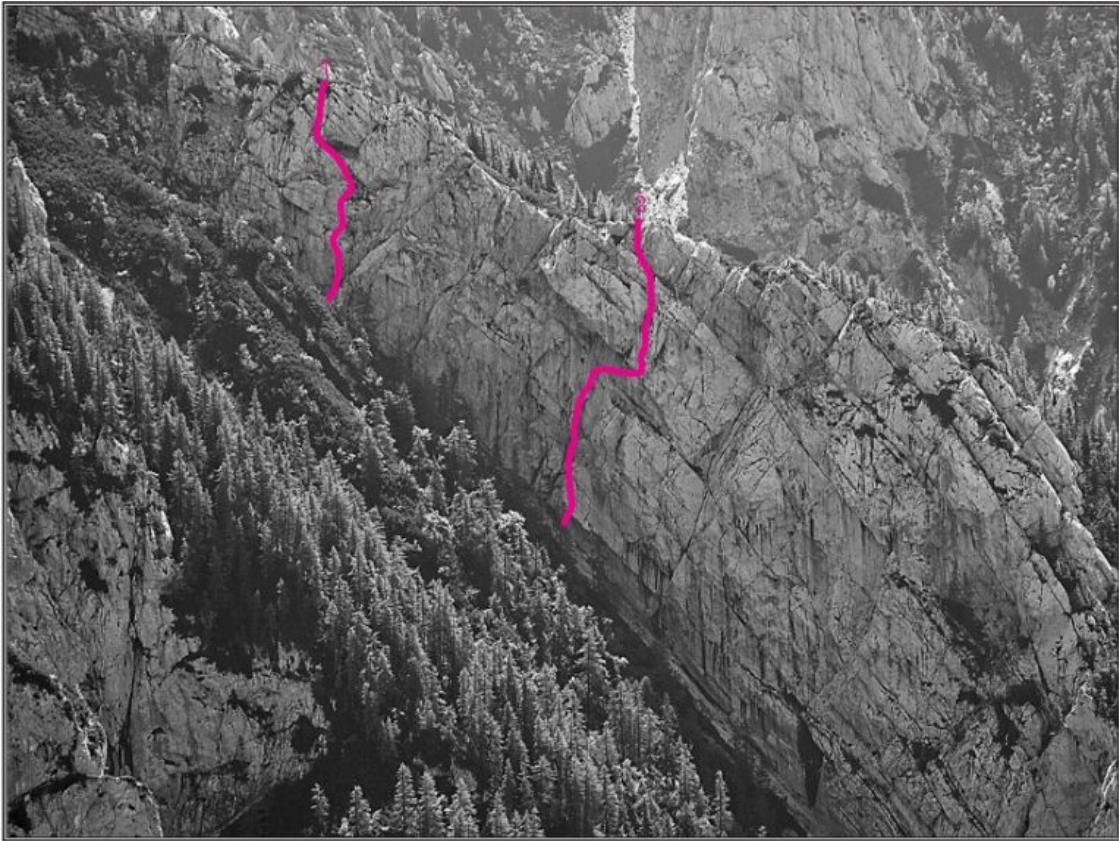
Železni graben, severna stena: 1 Lepa zajeda, 2 Tadejina smer.