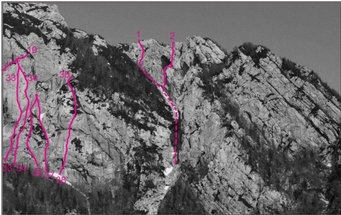
Vršiči, zahodna stena: 19 Zelena greda, 33 Spominska smer Marjana Perčiča, 34 Spominska smer Ceneta Kramarja in Jožeta Močnika, 36 Zajeda usmiljenja, 37 Botrova smer, 38 Čudna botra.