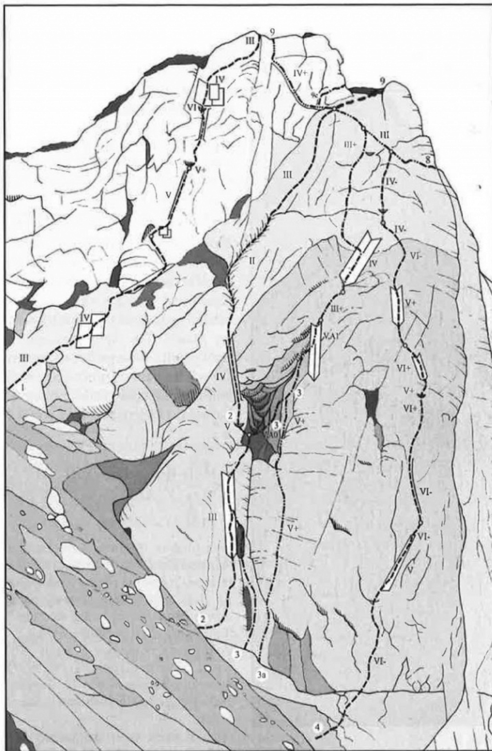
Skica 9 MALA RADUHA – vzhodna stena: 1 Diagonala, 2 Kamin pri Durcah, 3 Zdenkijeva, 3 a Vstopna varianta smeri Zdenkijeva, 4 Edijev steber. MALA RADUHA – severna stena: 8 Steber Male Raduhe, 9 ZZ, 9 c Skozi dimnik – izstopna varianta smeri ZZ.

Mala Raduha, vzhodna stena: 1 Diagonala, 2 Kamin pri Durcah, 3 Zdenkijeva, 3a Vstopna varianta smeri Zdenkijeva, 4 Edijev steber. MALA RADUHA, severna stena: 8 Steber Male Raduhe, 9 ZZ 9c Skozi dimnik - izstopna varianta smeri ZZ.