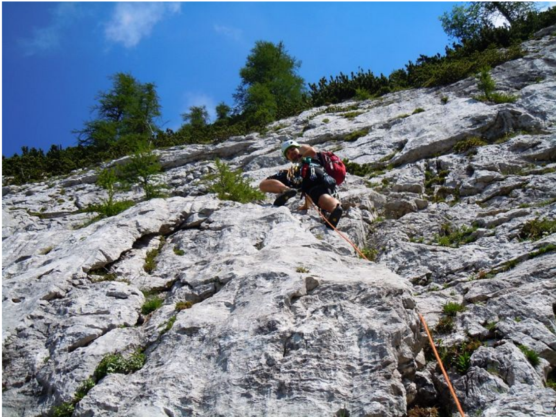
Ute, severozahodna stena: Kosmata smer (vstop).