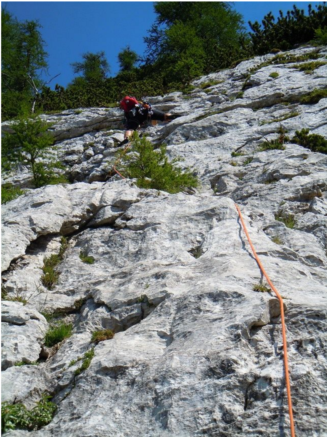
Ute, severozahodna stena: Kosmata smer (1 raztežaj).