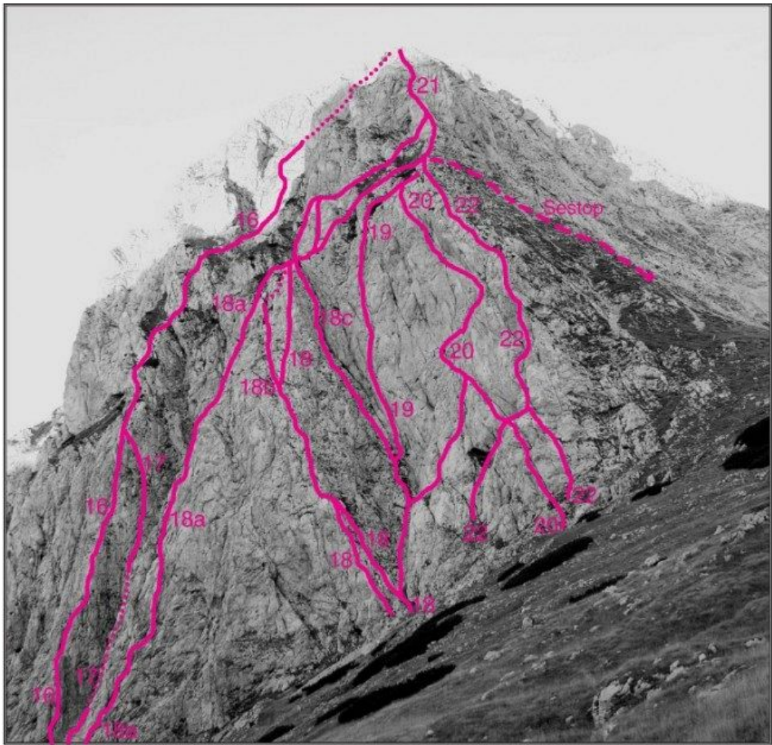
Brana, vzhodna stena 16 Spodnji steber, 17 Grapa med stebroma, 18 a Škarjeva varianta zgornjega stebra, 18b Leva varianta zgornjega stebra, 18 Zgornji steber, 20 Zajeda, 21 Šija Brane, 22 Pod Šijo.