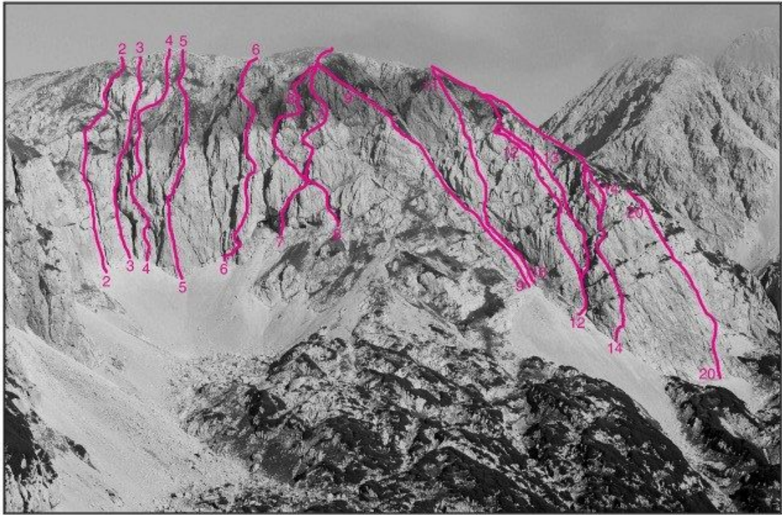
Kalški Greben, jugovzhodna stena: 2 Kamini, 3 Lukova smer, 4 Stanetova smer, 5 Direktna smer, 6 Smer Slaparjeve, 7 Resnikova smer, 8 Križna smer, 9 Zeleni rob, 10 Palovška smer, 11 Raz trojčkov, 12 Desna grapa, 14 Raz razočaranj, 16 Esasta, 20 Prvi tango.