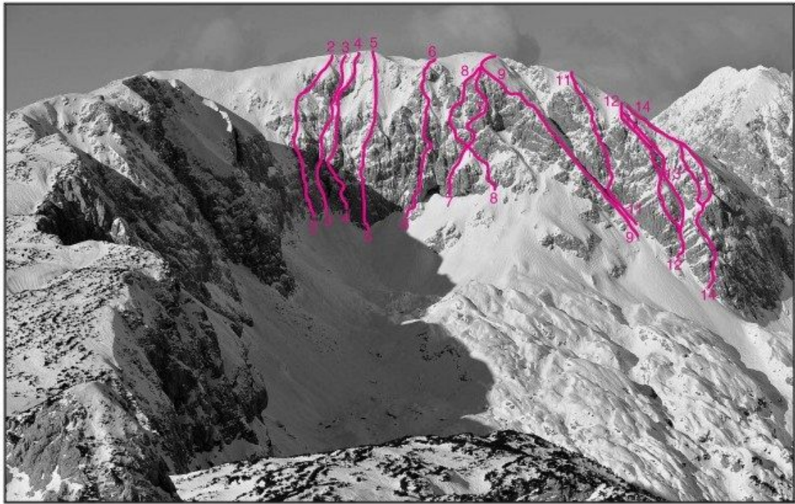
Kalški Greben, jugovzhodna stena: 2 Kamini, 3 Lukova smer, 4 Stanetova smer, 5 Direktna smer, 6 Smer Slaparjeve, 7 Resnikova smer, 8 Križna smer, 9 Zeleni rob, 10 Palovška smer, 12 Raz trojčkov, 13 Desna grapa, 14 Raz razočaranj.