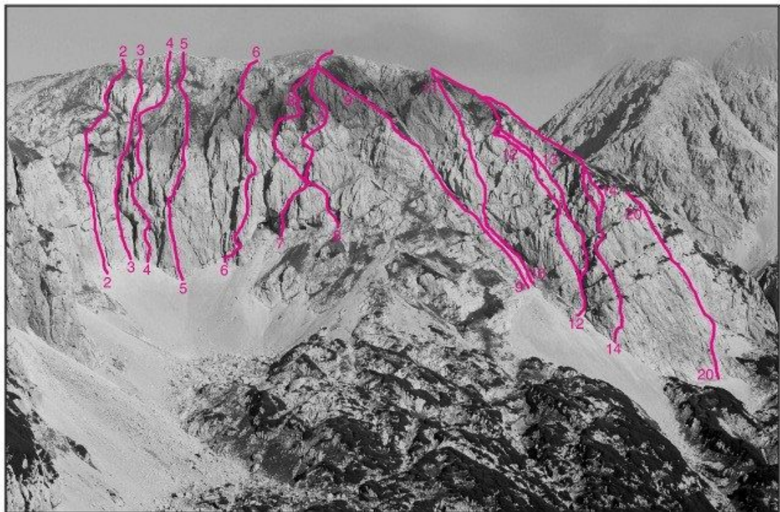
Kalški Greben, jugovzhodna stena: 2 Kamini, 3 Lukova smer, 4 Stanetova smer, 5 Direktna smer, 6 Smer Slaparjeve, 7 Resnikova smer, 8 Križna smer, 9 Zeleni rob, 10 Palovška smer, 11 Raz trojčkov, 12 Desna grapa, 14 Raz razočaranj, 16 Esasta, 20 Prvi tango.