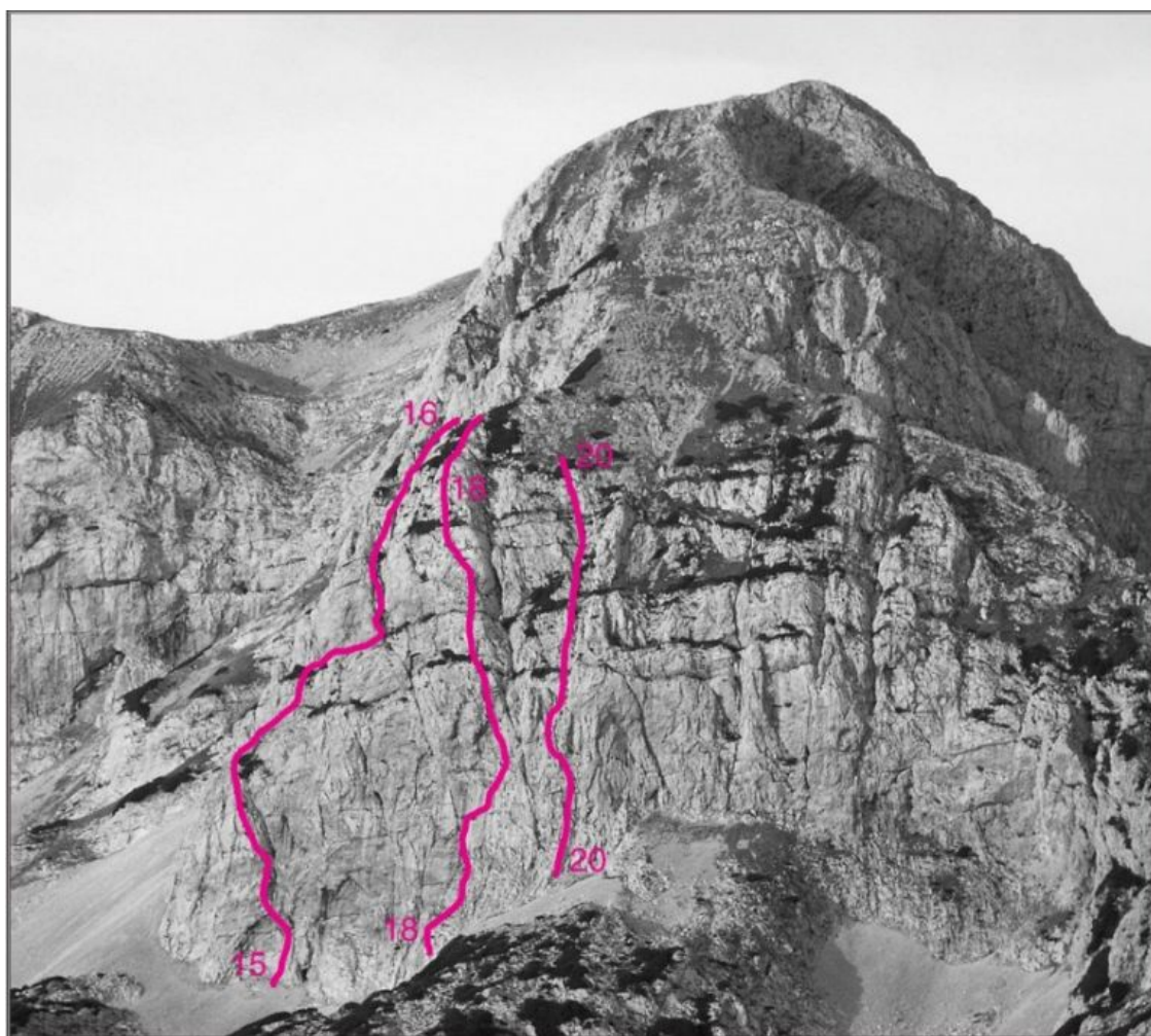
Kalški Greben, vzhodna stena: 15 Direktna varianta, 16 Esasta, 18 Dolga zgodba, 20 Prvi tango.