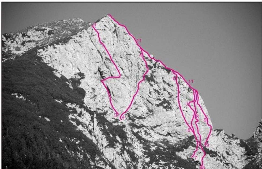
Mala Kalška Gora, vzhodna stena: 3 Muckina smer, 4 Miškina grapa, 6 Sončna smer, 7 Jeklne