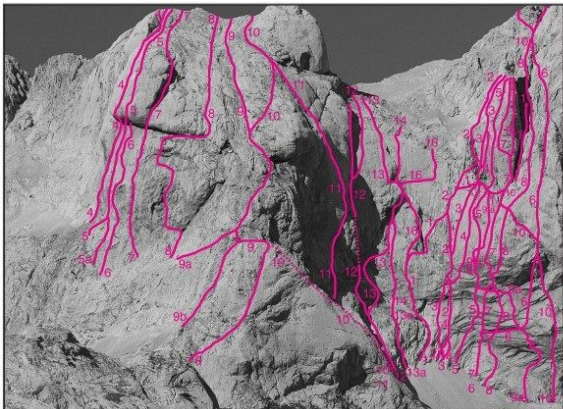
Štruca, zahodna stena: 4 Direktna smer, 5 Sanjsko potovanje, 5a Vstopna varianta, 6 Jagenjčki, 7 Smer treh svedrovcev, 8 Verina smer, Južna stena: 9 Smer Gregorin-Rihar, 9a Južni raz - varianta,