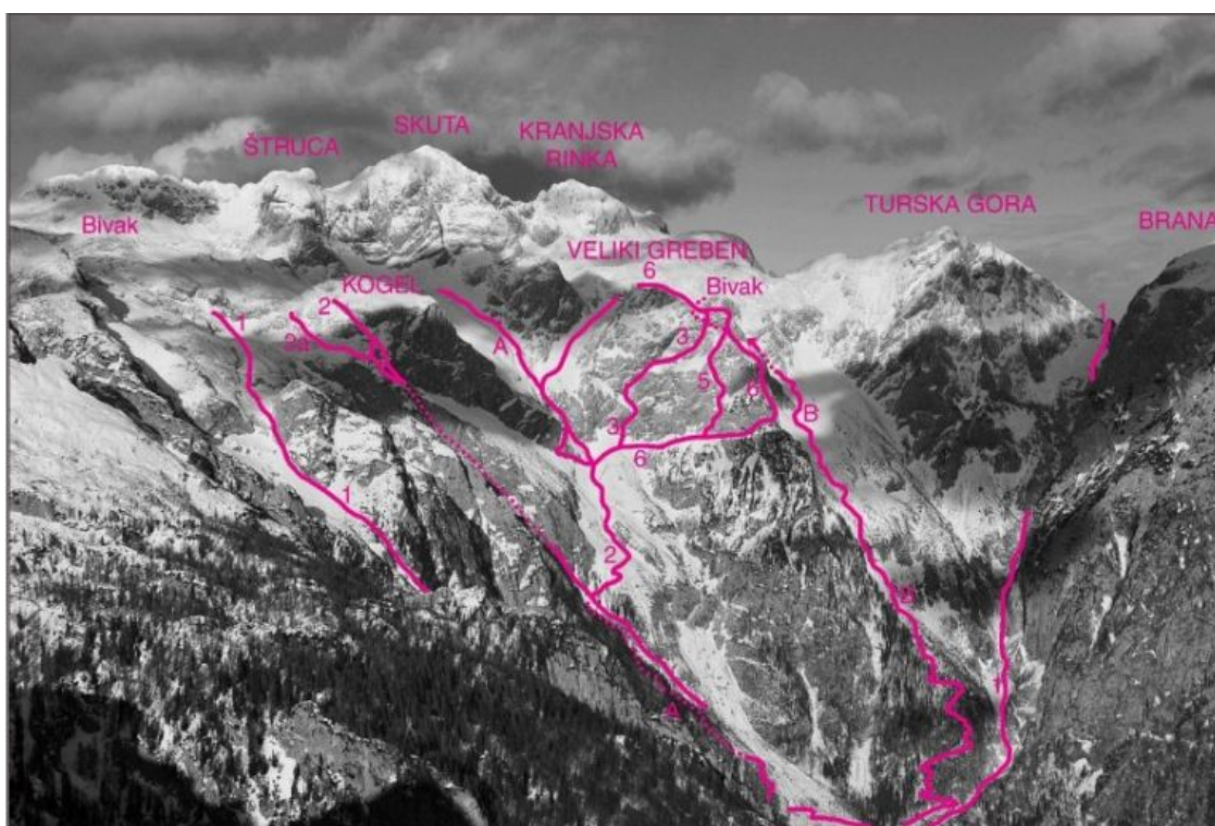
Veliki in Mali Hudi Graben, jugovzhodno pobočje: 1 Veliki Hudi graben, 2 Mali Hudi graben, 2a Bratova smer, A Steza čez Gamsov skret. Veliki Greben, jugozahodna stena: B Steza čez Žmavčarje, 1 Mokra, 3 Zimska, 5 Levi bok raza, 6 Raz velikega grebena. Brana, zahodna stena: 1 Kotliška grapa.