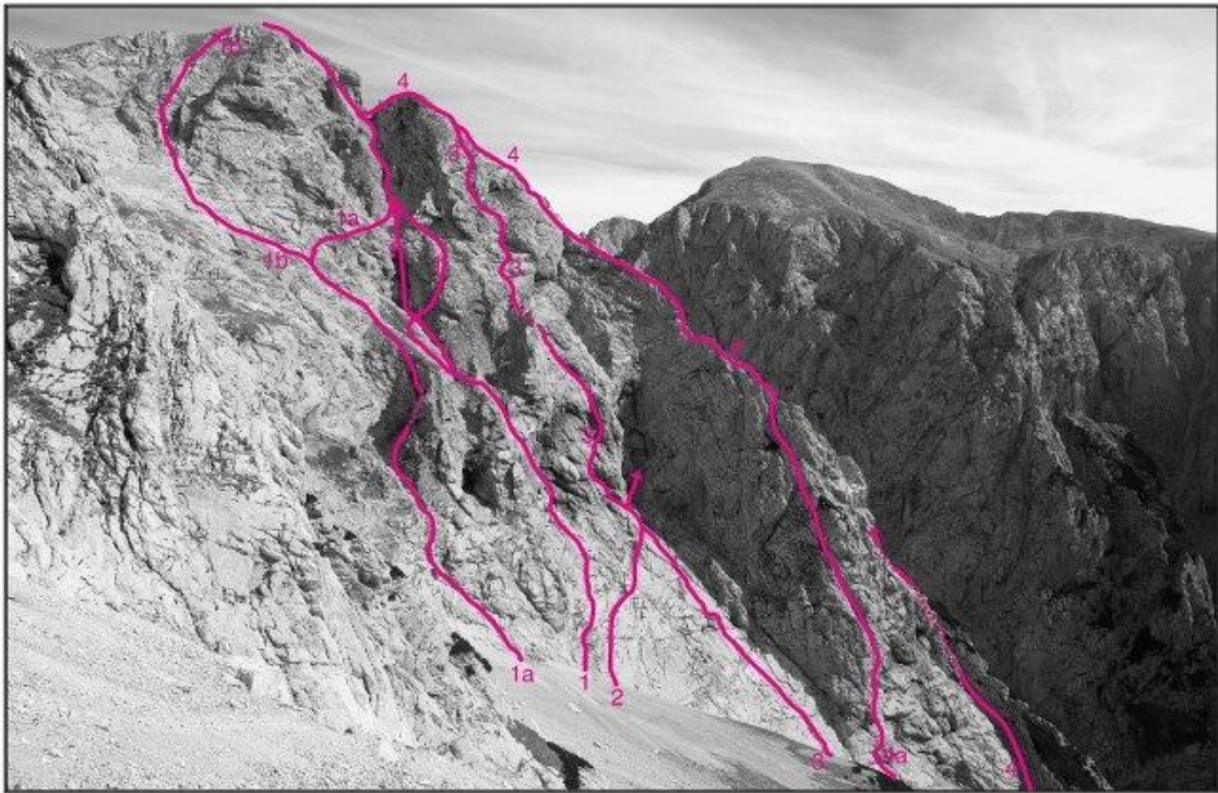
Turska gora, jugozahodna stena: 1b Leva grapa, 1a Vstopna varianta, 1 Turski slap, 2 Smisel nesmisla, 3 Polžek, 4a Jugozahodni raz - varianta Južnega raza, 4 Južni raz.