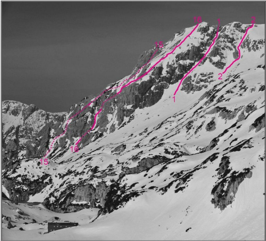
Zeleniške Špice, Najvišji Rob, jugovzhodna stena: 15 Nadomestna smer, 16 Grapa. ZELENišKE ŠPICE, Najvišji Rob, vzhodna stena: 1 Grapa skozi okno, 2 Grapica.