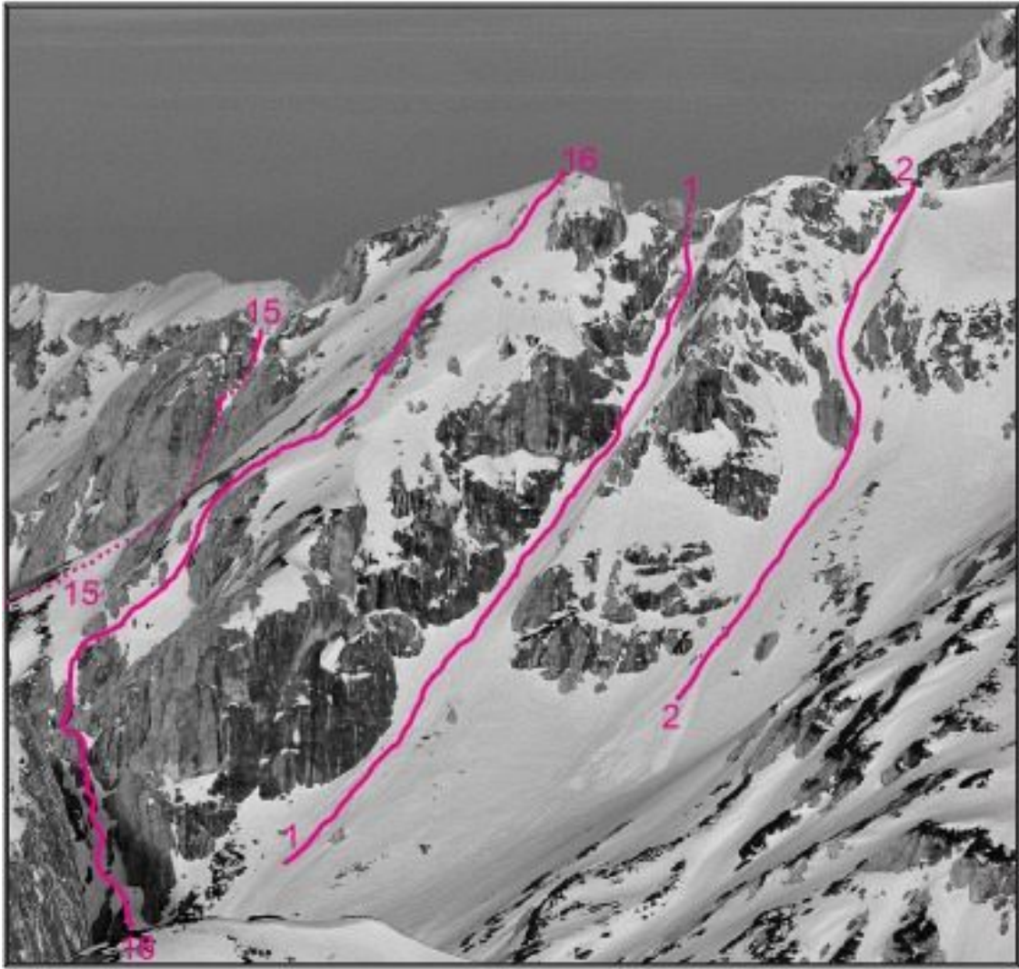
Zeleniške Špice, Najvišji Rob, jugovzhodna stena: 15 Nadomestna smer, 16 Grapa. Zeleniške Špice, Najvišji Rob, vzhodna stena: 1 Grapa skozi okno, 2 Grapica.