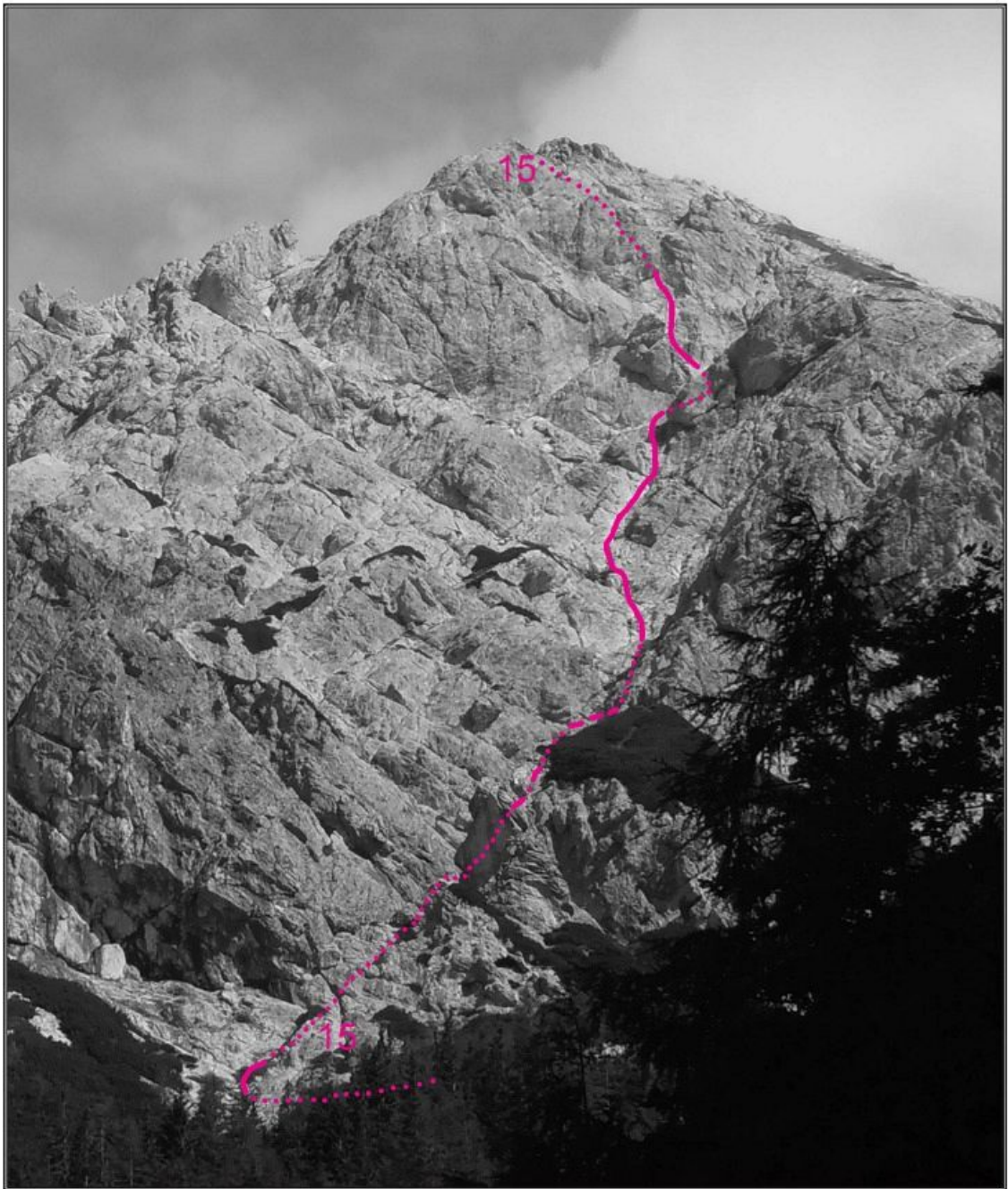
Zeleniške Špice, Najvišji Rob, jugovzhodna stena: 15 Nadomestna smer.