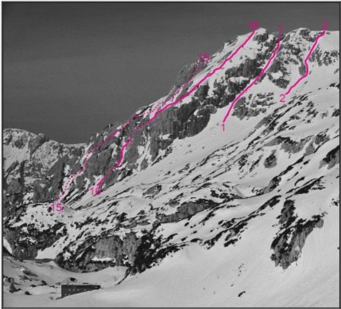
Zeleniške Špice, Najvišji Rob, jugovzhodna stena: 15 Nadomestna smer, 16 Grapa. Zeleniške Špice, Najvišji Rob, vzhodna stena: 1 Grapa skozi okno, 2 Grapica.