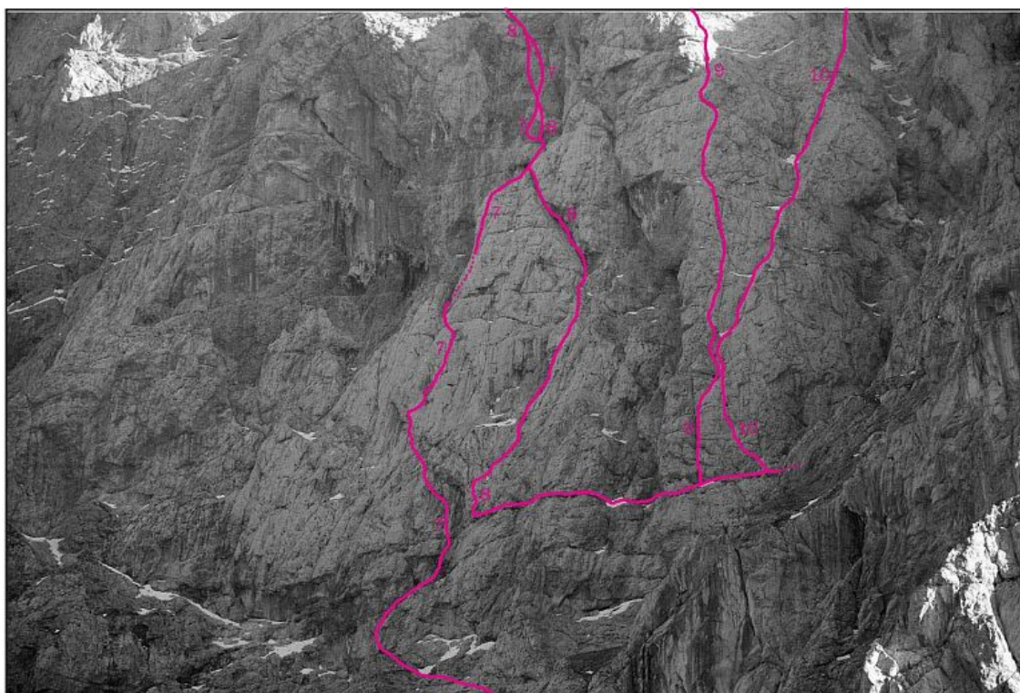
Prisank, severozahodna stena: 7 Dešpet, 8 Beli trikotnik, 9 Strašni mišek, 10 Beli steber.