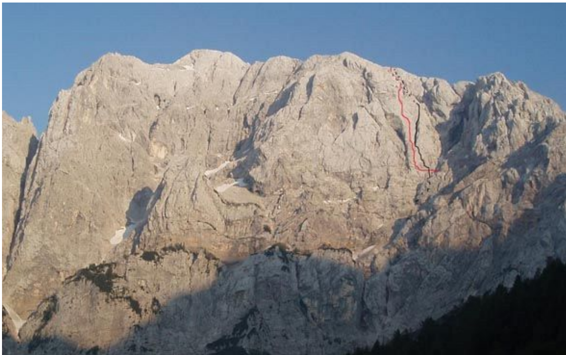
slika: Strašni mišek