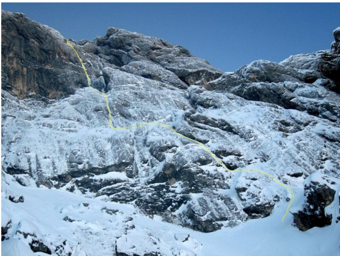
zgornji del smeri