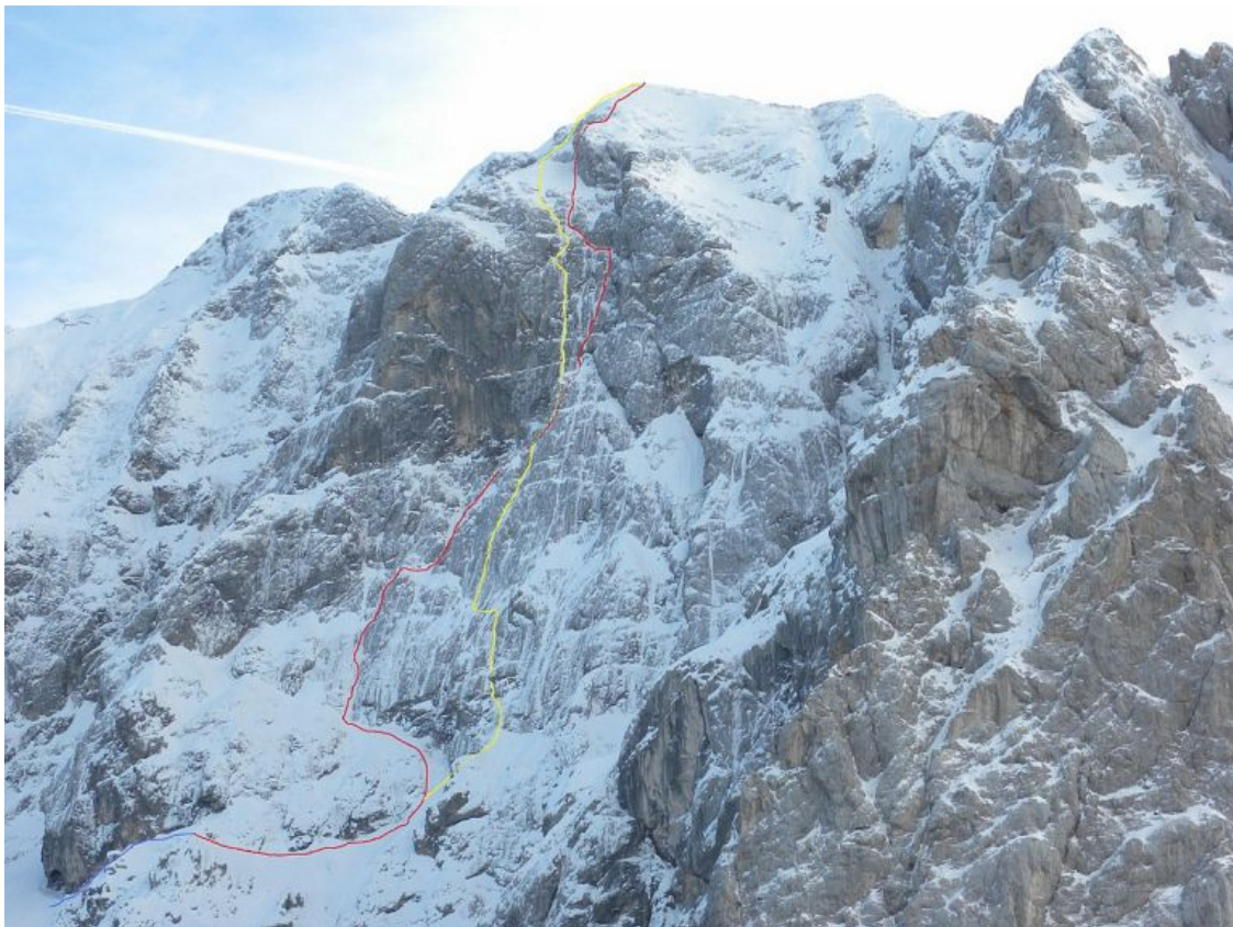
rumena Apokalipsa, rdeča Kozmična kataklizma